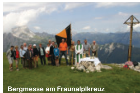
Bergmesse am Fraunalplkreuz

Highlight aber war die Romreise zur 20-Jahrfeier der Seligsprechung von Adolph Kolping. Vereinsübergreifend erlebten 32 Kolpinger und Trachtler fröhliche und bewegende Tage in Rom. Besonders eindrucksvolle Elemente waren die Generalaudienz bei Papst Benedikt und der Abschluss-