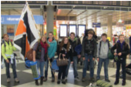
„Guad, dass Di gibt“