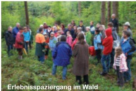
Erlebnispaziergang im Wald