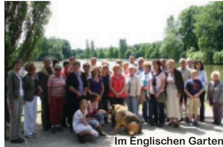
Im Englischen Garten

Wir schauen zurück auf ein bewegtes Jahr: Auf eine kundige Führung durch den Englischen Garten und einen Erlebnispaziergang im Biberkorer Holz mit unserem Patenverein Schäftlarn und Förster Achim Lohse, auf die Bergmesse am Fraunalpl und die Besichtigung des über 1000 Jahre alten Kreuzes in Schaftlach; und auch der „Klassiker“ Kleidersammlung durfte natürlich nicht fehlen.