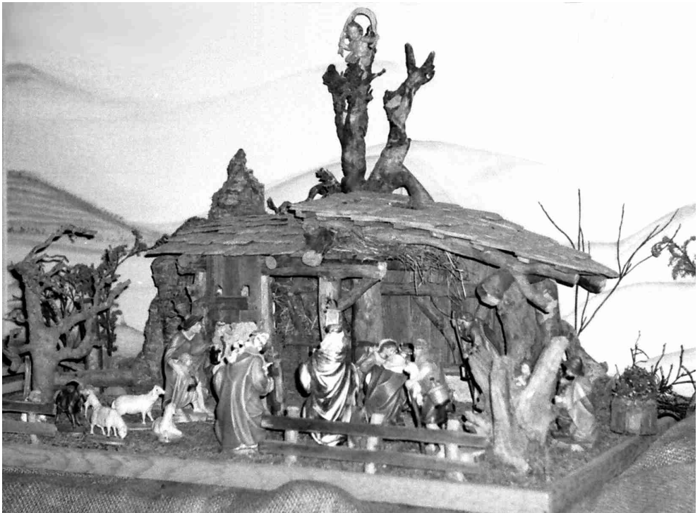
Weihnachtskrippe in der Pfarrkirche Herz Jesu, Höhenrain